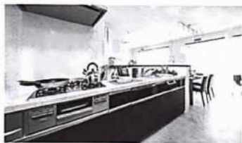
「江戸川中央内装サービス」が提案するシステムキッチンの一例

そうですね。一般的に男性よりも女性のほうが自宅にいる時間が長いですし、主婦としての目線で家の中を見ることができると、男性とは別の視点でアドバイスができると思います。たとえば、キッチンのリフォームは需要が高いですが、その際にはデザイン性だけではなく、どのように動線を確認すれば調理や片付けがしやすいか、という点も重視します。最近のキッチンには人間工学に基づいて設計され、本当に使いやすいものが多いです。